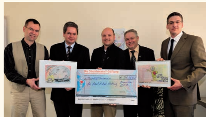
Übergabe der Jahreszuwendung von Strahlemann an die Karl-Kübel-Stiftung für das Projekt Nagapattinam.

Einen äußerst positiven Einfluss durch die ganzheitliche Betreuung der Mädchen und Jungen konnte in einer nachweislichen Verbesserung der Schulleistungen festgestellt werden. Nach Angaben des Lehrpersonals haben die Kinder deutliche Fortschritte in ihren schulischen Leistungen erzielt. Von 25 Kin-