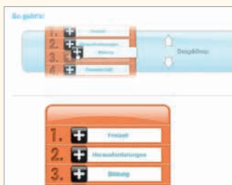
Talent2Go mit Drag & Drop Funktionen

Schauen Sie doch einfach mal rein ( www.talent2go.de ) und lassen Sie sich überzeugen. Nähere Auskünfte über die Neuerungen und Zugangsdaten erhalten Sie über das Strahlemann®-Office in Heppenheim.