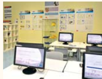
Ein Blick in die neue „Zukunftswerkstatt“ an der GAZ Reichelsheim.

Die Schüler können im Rahmen der Arbeitsgemeinschaft heimische Unternehmen besuchen, um verschiedenste Berufe in der Praxis kennenzulernen. Und auch für gemeinsame Aktivitäten ist gesorgt: Ob beim Sporttag oder beim gemeinsamen Kochen.