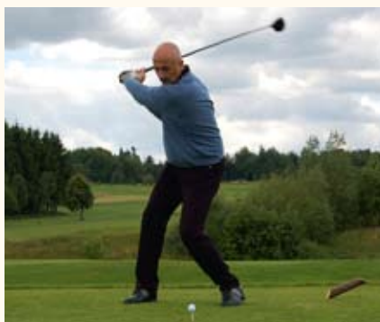
Abschlag für den guten Zweck

Programm noch umfangreicher: Am ersten Tag, dem 14. Juni, startet ein Teamturnier gemeinsam mit den Promis. Ab 18 Uhr schließt sich im Clubheim die Players Party an. Am 15. Juni findet dann das Einzelturnier statt.